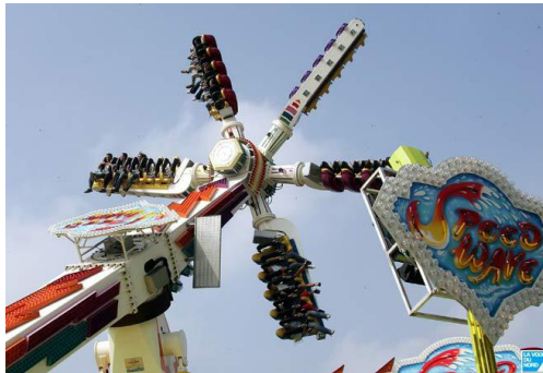
FIGURE 1 – Le Speed Wave

On s'intéresse au manège Speed Wave présent dans de nombreuses fêtes foraines. Ce système est constitué de 4 solides :